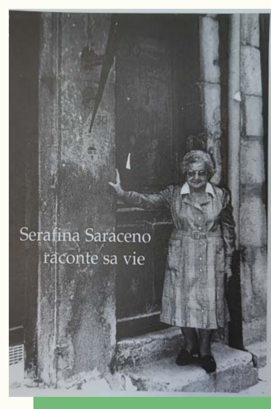
Couverture du livre de Otto Samson, «Serafina Saraceno raconte sa vie»

Lorsqu'ils arrivent à Grenoble, de nombreux Coratins posent leurs bagages dans la rue Saint-Laurent. Serafina Saraceno arrive à Grenoble en 1922. Le récit qu'elle livre témoigne du quotidien d'une immigrée coratine de l'époque.